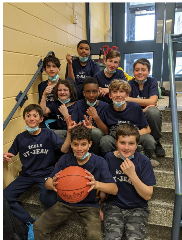
Les représentants de l'école au tournoi inter-école de basketball.

N'oubliez pas que les conseils d'établissement sont ouverts au public, vous êtes les bienvenus. Si vous avez des questions ou des commentaires, communiquez avec moi marieeve.me@gmail.com