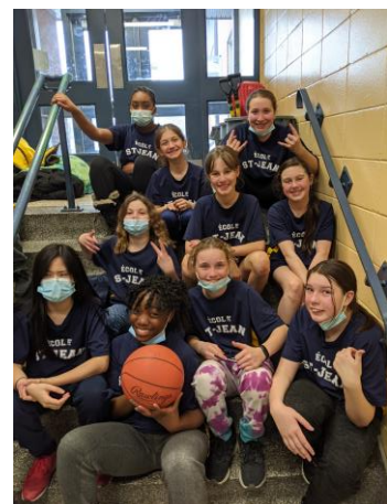
Les représentantes de l'école au tournoi interécoles de basket-ball.

Une somme de 2932$ a été remise à notre école par l'organisme Opération Enfant soleil suite à une demande d'aide déposée par l'école et l'implication d'un parent. Ce don servira à actualiser les paniers de basket-ball du gymnase. Merci à Opération Enfant Soleil!